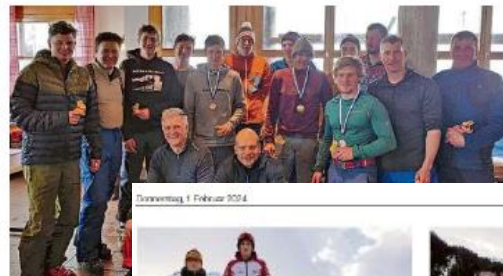
Die Herrenkategorie feiert ihre Sieger mit

Weitere information und Rangliste: sctambospluegen.ch