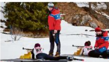
Las tiradoras d'igl biatlon agi stand da saglar.

Igl unilento salogrovon ges ondivens raxod setg, garagid ca la distoplegia d'igl biatlon fantasciica igli sportista giverna la OC ca tressen han del nordic. Igl tar da quella cura vasa scampagnia. Da quella munita d'igl car puvovod a storditas a stradats givovon mampuvovod da giv novavas experientzas.